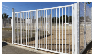
PORTAIL DOUBLE VANTAUX