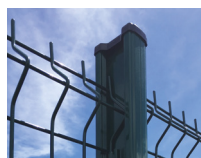
Poteau H alu 250