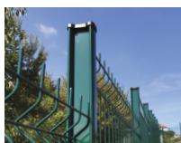
Poteau H alu 155**