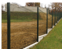
Montage en redan