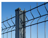
Poteau H à encoches