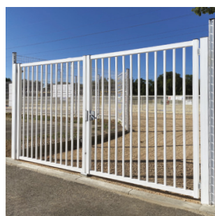
PORTAIL DOUBLE VANTAUX